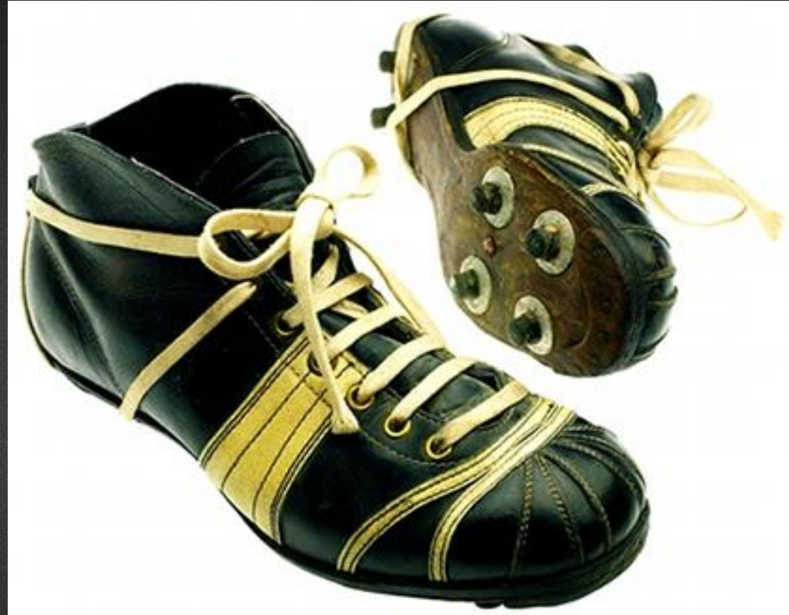
Модель SUPER АТОМ , 1953 год